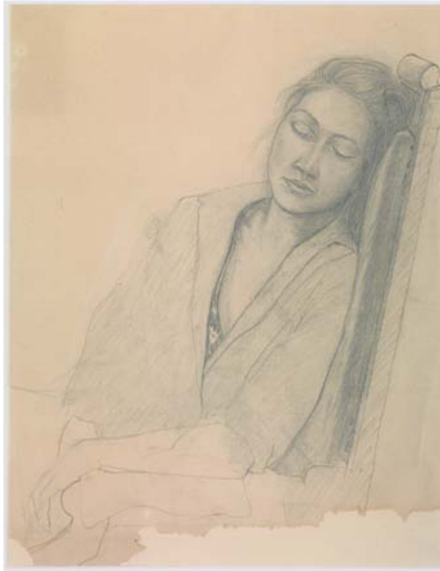
Nina 1984, pencil on paper, 76 × 46 cm Collection of the artist

Eine Kunst der Ruhe. Die Landschaften geben der Einsamkeit Raum, die Gebäude sind hermetisch, selbst wenn sie von Zerstörung und Verfall bedroht sind, die Räume atmen Stille, die Menschen halten inne, mal nur für einen Moment, oft sind sie an ihre Gedanken und ihre Gefühle verloren.