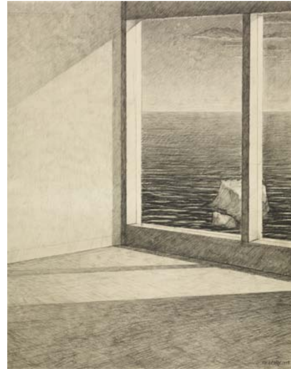
Seal Rock 1979, Charcoal pencil on paper, 88.3 × 69.2 cm Collection of Marlene Porsche